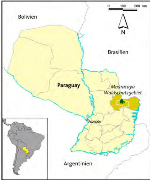
Lage des Mbaracayú-Waldschutzgebietes in Paraguay.

Paraguay in den 1970er Jahren: Die Regierung verkauft nach und nach große Waldstücke an internationale Holzfirmen und Agro-Industrielle. Die bislang in den Wäldern lebenden Indigenen werden dabei häufig von ihrem Land vertrieben und in kleinräumige Reservate umgesiedelt. Innerhalb weniger Jahrzehnte verliert das Land einen Großteil seiner Urwälder, die unaufhaltsam landwirtschaftlichen Nutzflächen weichen. Es gilt, den weltweit steigenden Bedarf an Holz, Fleisch und Soja zu decken. So werden allein in Paraguay zwischen 1990 und 2010 knapp 3,6 Millionen Hektar Wald gerodet oder niedergebrannt.