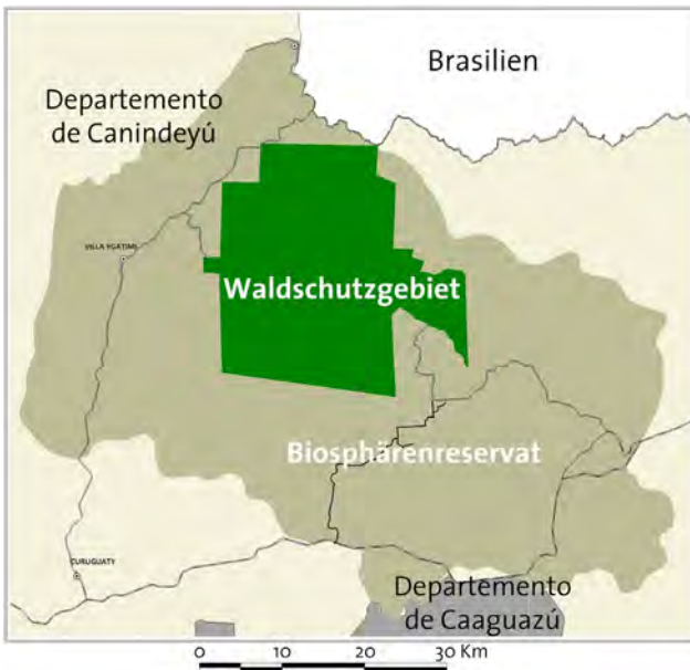
Lage des Waldschutzgebietes innerhalb des umliegenden Biosphärenreservats.

Eine 1991 (und damit geraume Zeit vor der Einführung der internationalen Verpflichtungen zur Reduzierung von Treibhausgasemissionen) erstellte Studie ermittelte, dass die Flächen des Mbaracayú Waldschutzgebiets in den nachfol-