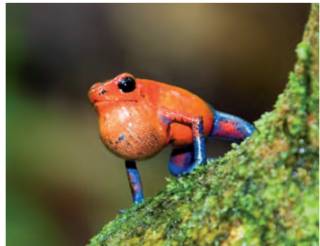
Im Waldschutzgebiet lebt eine große Vielzahl bedrohter Tierarten.