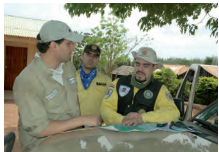
Park-Ranger überwachen die Einhaltung der vereinbarten Nutzungsregeln.

Bisherige Konflikte in und außerhalb des Waldschutzgebiets betreffen vor allem Streitigkeiten über ungeklärte Landnutzungsrechte. So behaupteten Viehzüchter, die ihre Tiere auf den nordöstlich angrenzenden Flächen weiden lassen, dass das Schutzgebiet sich mit Teilen ihrer angestammten Weideflächen überschneidet. Durch eine erneute Überprüfung der Besitzurkunden, eine verstärkte Markierung aller Grenzen sowie die Überwachung der Flächen, versucht die MBS die Nutzung der Randzonen des Waldschutzgebiets einzudämmen. Eine schwaches Rechtssystem und die teilweise schlechte Datenverfügbarkeit erschweren oft die Arbeit. Oberstes Ziel ist es, die Menschen „mit ins Boot“ zu holen, d.h. möglichst in die ländlichen Entwicklungsaktivitäten zu integrieren.