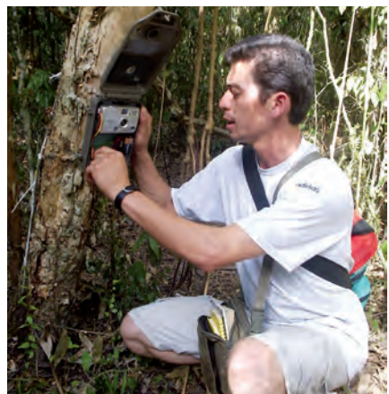
Ein Monitoring ist Voraussetzung für eine sorgfältige Projektevaluation.

Um die Entwicklung der Artenzahlen permanent im Auge zu behalten, werden im Mbaracayú-Waldschutzgebiet verschiedene Aktivitäten zum Monitoring durchgeführt: Es wurde eine umfangreiche Flora und Fauna Datenbank nach internationalen Naturschutzkategorien angelegt, die regelmäßig durch Zählungen und Arteninventuren, z.T. unter Einsatz moderner Technologien wie der Auswertung von Satellitenbildern, aktualisiert wird. Es verwundert nicht weiter, dass viele der in Mbaracayú