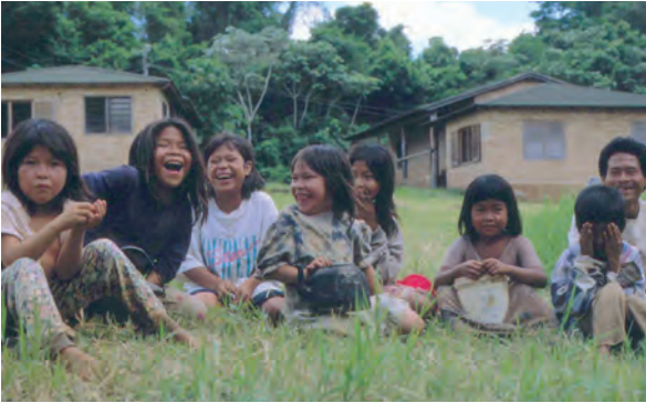
Das Schutzgebiet umfasst Teile der Jagd- und Sammelgründe angrenzender Gemeinden der indigenen Gruppe der Aché.