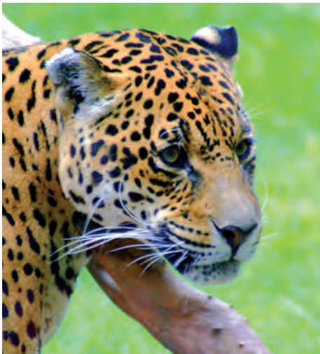
Auch der Jaguar ist im Waldschutzgebiet heimisch.

Das Mbaracayú-Waldschutzgebiet umfasst 64.400 Hektar des stark bedrohten Atlantischen Regenwalds (Mata Atlântica) im Osten Paraguays. Der Erwerb dieses an Brasilien angrenzenden Waldes wurde 1992 zum Großteil mit Geldern des US-amerikanischen Energiekonzerns Applied Energy Services (AES) ermöglicht und stellt eines der ersten Waldklimaschutz-Projekte weltweit dar. AES zahlte damals zwei Millionen US-Dollar an die für die Errichtung des Gebiets verantwortliche Moisés Bertoni Stiftung (MBS) und die amerikanische Umweltschutzorganisation The Nature Conservancy (TNC). Die Organisationen setzten sich gemeinsam gegen die Rodung des Waldes ein und stellten damit dessen langfristigen Erhalt und die Speicherung großer Mengen CO 2 sicher. Durch die Finanzierung dieser „vermiedenen Entwaldung“ kompensiert AES - lange Zeit vor der Debatte um Klimaschutz und Treibhausgaseinsparpotentiale - freiwillig die Emissionen seines auf Hawaii 1992 in Betrieb genommenen 180-Megawatt Kohlekraftwerks.