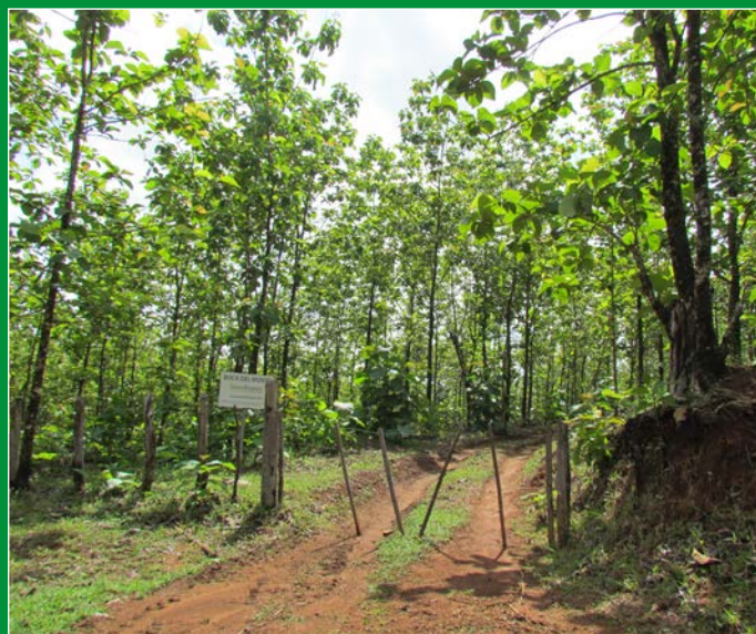
Eingangsbereich der Finca del Monte.

Für die Zukunft ist im Rahmen der FSC-Re-Zertifizierung sowie durch die „School of Nature Management S. A.“ ein soziales Monitoring geplant. Weitere Angaben dazu sind nicht bekannt und die laut BaFin-Prospekt jährlichen Berichte der für Überwachung und Beratung eingesetzten „School of Nature Management S.A.“ lagen nicht vor.