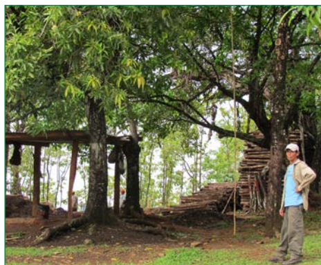
Arbeiter und gerentetes Holz im Eingangsbereich der Finca.