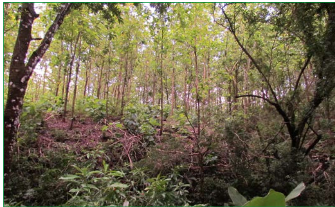
Blück in die bewirtschaftete Teakplantage an einem Gewässerlauf (am Fuß des Hangs).