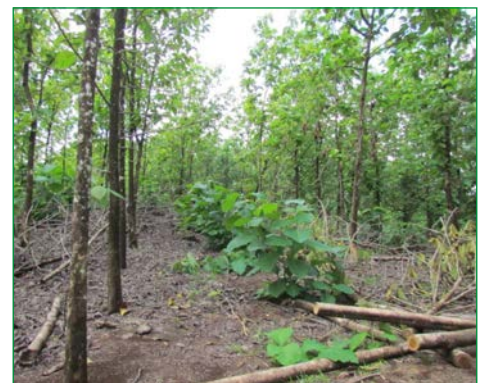
Projektfläche während der Durchforstung.