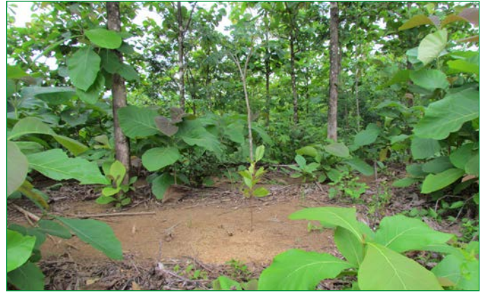
Akaziensetzling ( Acacia mangium ), der in der Teakplantage neu angepflanzt wurde; wie Teak ist diese Art in Panama exotisch und hat invasives Potenzial.

Es wurde vor Projektbeginn vom Anbieter eine Studie zu „High Conservation Value Forests“ (Wälder mit einem hohen Wert für den Naturschutz) durchgeführt. Demnach gibt es diesbezüglich keine bedeutenden Flächen. Die Studie ist aber qualitativ von begrenzter Aussagekraft da sie z. B. nur teilweise Informationen zum Gefährdungsgrad der verschiedenen Tier- und Pflanzenarten enthält. Im Rahmen der Fallstudie lagen keine speziellen Beschreibungen zu Wassereinzugsgebieten, Ökosystemen und ihren Funktionen vor. Auch bezüglich der Auswirkungen des Projekts auf die Biodiversität gab es keine spezifischen Berichte.