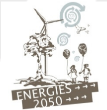
ENERGIES 2050 (FRANCE)