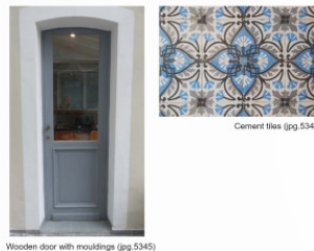
EXAMPLE OF AN INVENTORY FOR THE KITCHEN