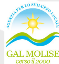
GAL MOLISE VERSO IL 2000 (ITALY)